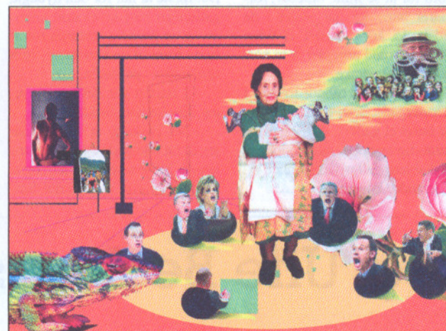
Maskulin aggression og naturlig oprigtighed mødes i denne fotocollage af Kirsten Otzen Keck. Fra serien "Circle of Things".

Galerie Pi Dag Hammerskjølds Alle 33 København Ø Frem til den 10. januar 2009